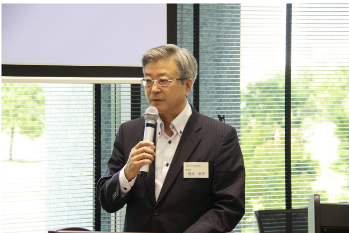
日本下水道協会 岡久理事長より来賓挨拶の様子